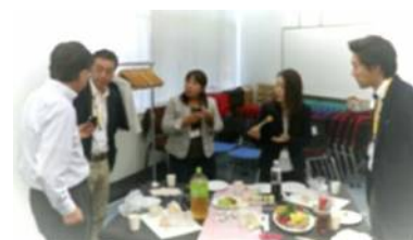
2019年9月講習会後のネットワーキング