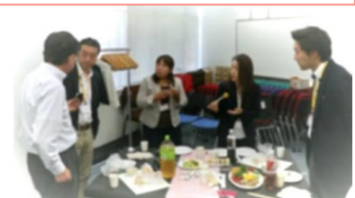
2019年9月講習会後のネットワーキング