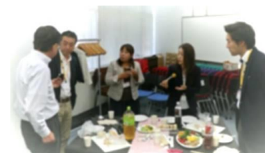
2019年9月講習会後のネットワーキング